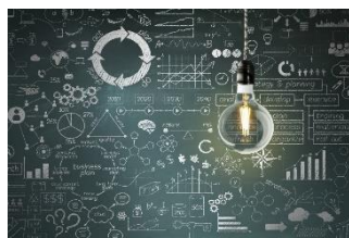
デジタル戦略策定