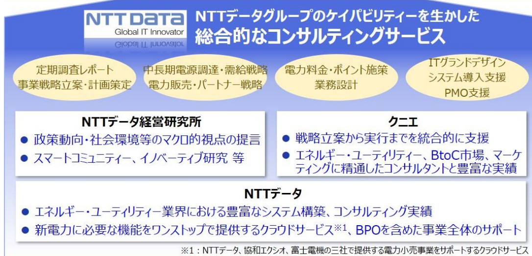
図：新電力への総合的なコンサルティングサービス 概要図